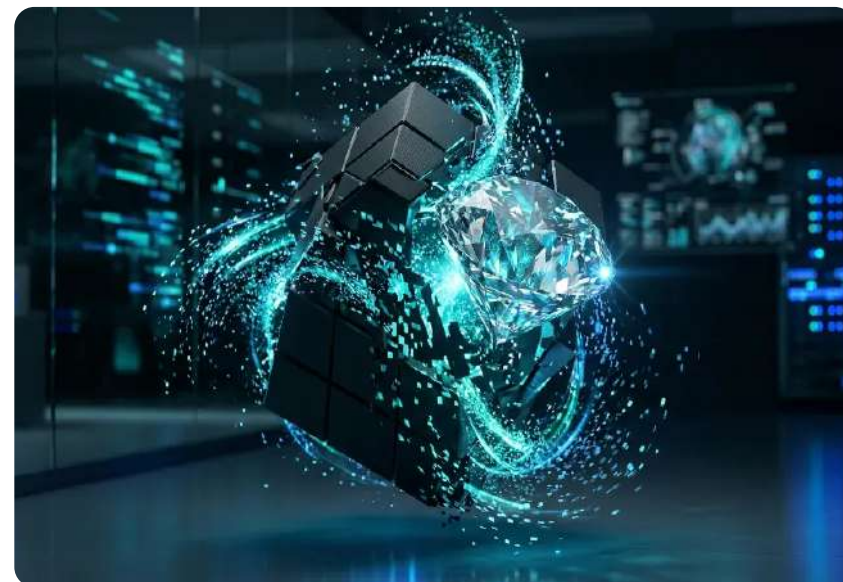
De Basic IT a Innovación Estratégica

No comercializamos solo equipos: suministramos, diseñamos, implementamos y administramos tecnología alineada al negocio.